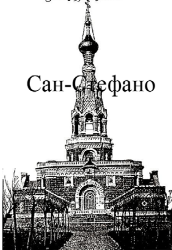
Русский Мемориал-Усыпальница Сан-Стефано в Стамбуле.

Monument Russe à St. Stéfano ایاستفانوسمه روس قلعسی Сан-Стефано